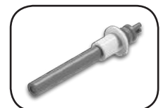
Resistenza in ceramica