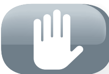
Tasto di spegnimento

il meccanismo blocca-stoppino limita la regolazione dello stoppino e quindi l'altezza della fiamma, assicurando così una combustione più pulita.