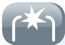
Sistema ccensione spark

un modo nuovo per avvitare il tappo del serbatoio in maniera facile e pulita evitando il contatto diretto.