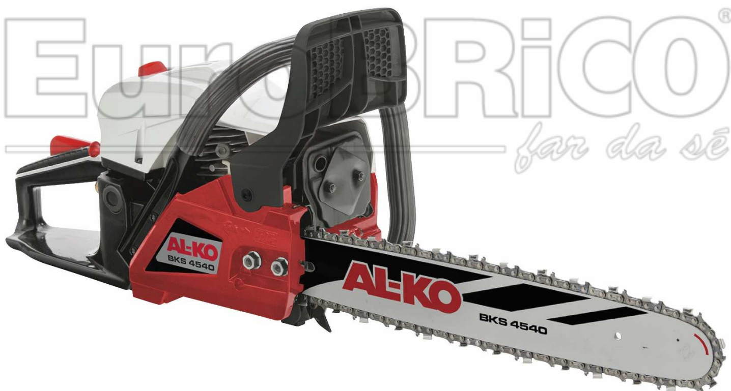
Motosega a scoppio AL-KO BKS 4540