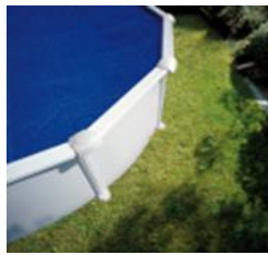
CPROV610 Cubierta Isotérmica Copertura Isotermica