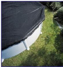
CIPROV611 Cubierta de Invierno Copertura invernale