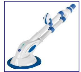
Limpiadores automáticos Puliscifondi automatici