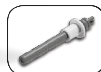
Resistenza in ceramica