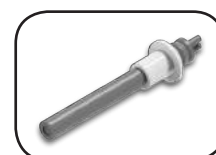
Resistenza in ceramica