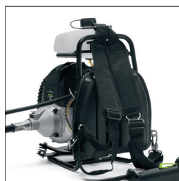
ZAINO CON CINGHIE