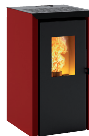
rosso cod. 72410373051