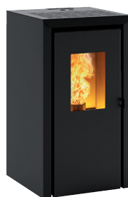
nero cod. 72410373001

* Il valore riportato di superficie riscaldabile (riferito ad ambienti h. 2,70 m) è puramente indicativo. Data l'infinita possibilità di situazioni che possono verificarsi nelle installazioni, non si garantisce la corrispondenza dei numeri indicati a tutte le applicazioni.