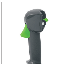
VARIATORE DI VELOCITÀ ELETTRONICO