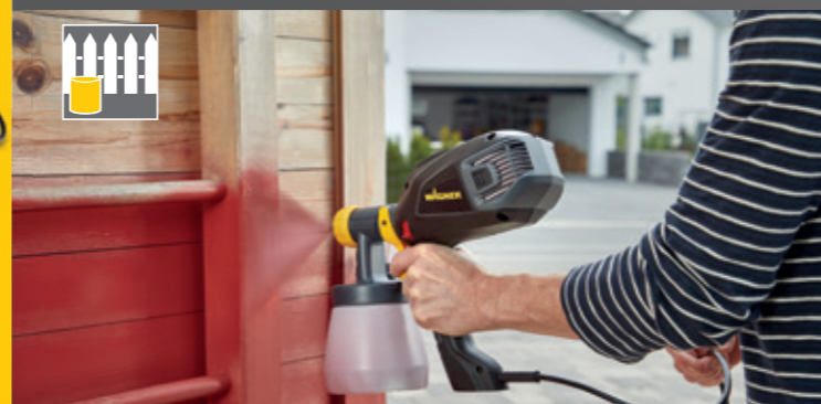
800 ml attacco per verniciare legno e metallo