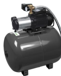
PRS100MCA5GD / 516311