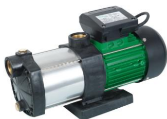
PRMCA3P / 516256

EN MULTISTAGE PUMP & MULTISTAGE WATER PUMP WITH TANK User and maintenance manual