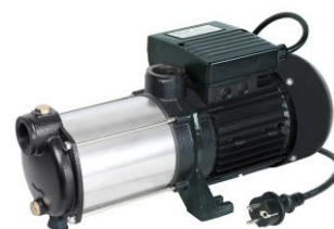
PRMCA5GD / 516176