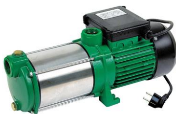
PRMCA5 / 516146