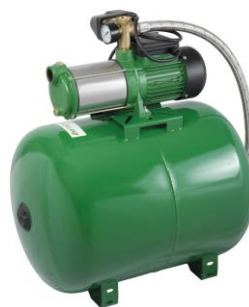
PRS100MCA5 / 516301