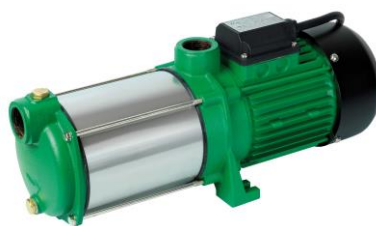
PRMCA5/T / 516276