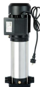
PRMCA10/V / 516266