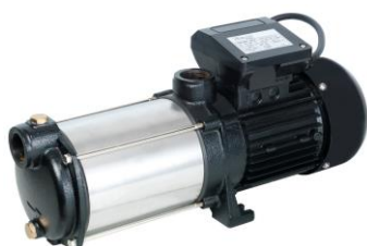
PRMCA5PRO / 516246