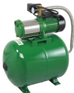
PRS60MCA5 / 516281